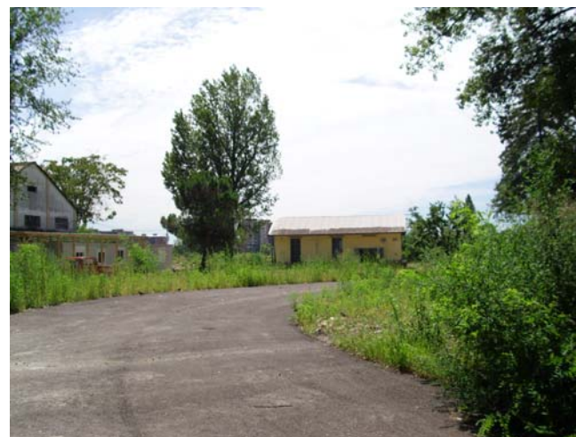
L'area ex-Falck: qui potrebbe crescere un bosco