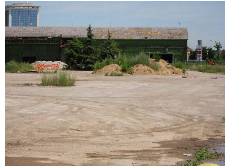
L'area dismessa come si presenta oggi

Quali sono le meraviglie urbanistiche promesse dal piano Zunino con la collaborazione di Renzo Piano ?