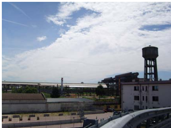
L'area ex-Falck oggi, vista dal ponte sulla ferrovia

Chiusa l'epoca industriale di Sesto San Giovanni, vaste aree dismesse tra cui l'area ex-Falck, occupate ormai solo da qualche relitto siderurgico, da erbacce e cumuli di macerie, sono pronte per una nuova destinazione d'uso.