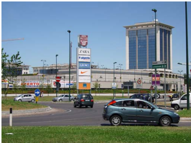
Il centro commerciale Vulcano - una "cattedrale" del consumismo